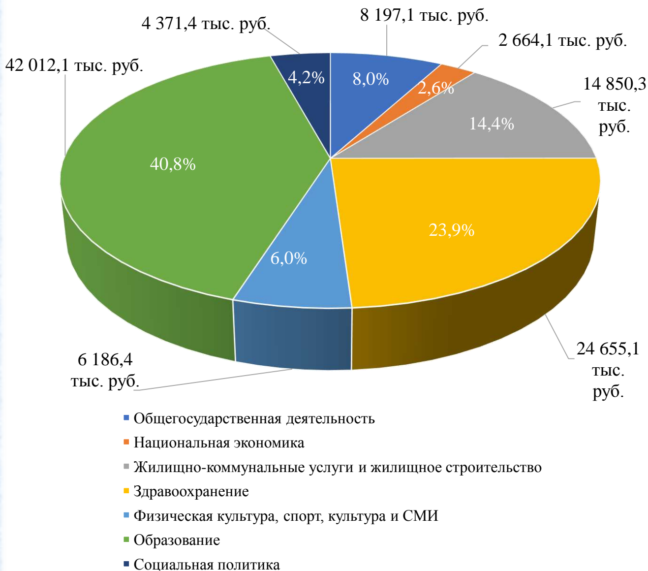
Структура расходов консолидированного бюджета Горецкого района на 2024 год

Общий объем расходов консолидированного бюджета на 2024 год определен в сумме 102 971,7 тыс. рублей. Консолидированный бюджет района сохранит социальную направленность: на финансирование отраслей социальной сферы планируется направить 77 225,0 тыс. рублей или 75,0 % от всех расходов бюджета.